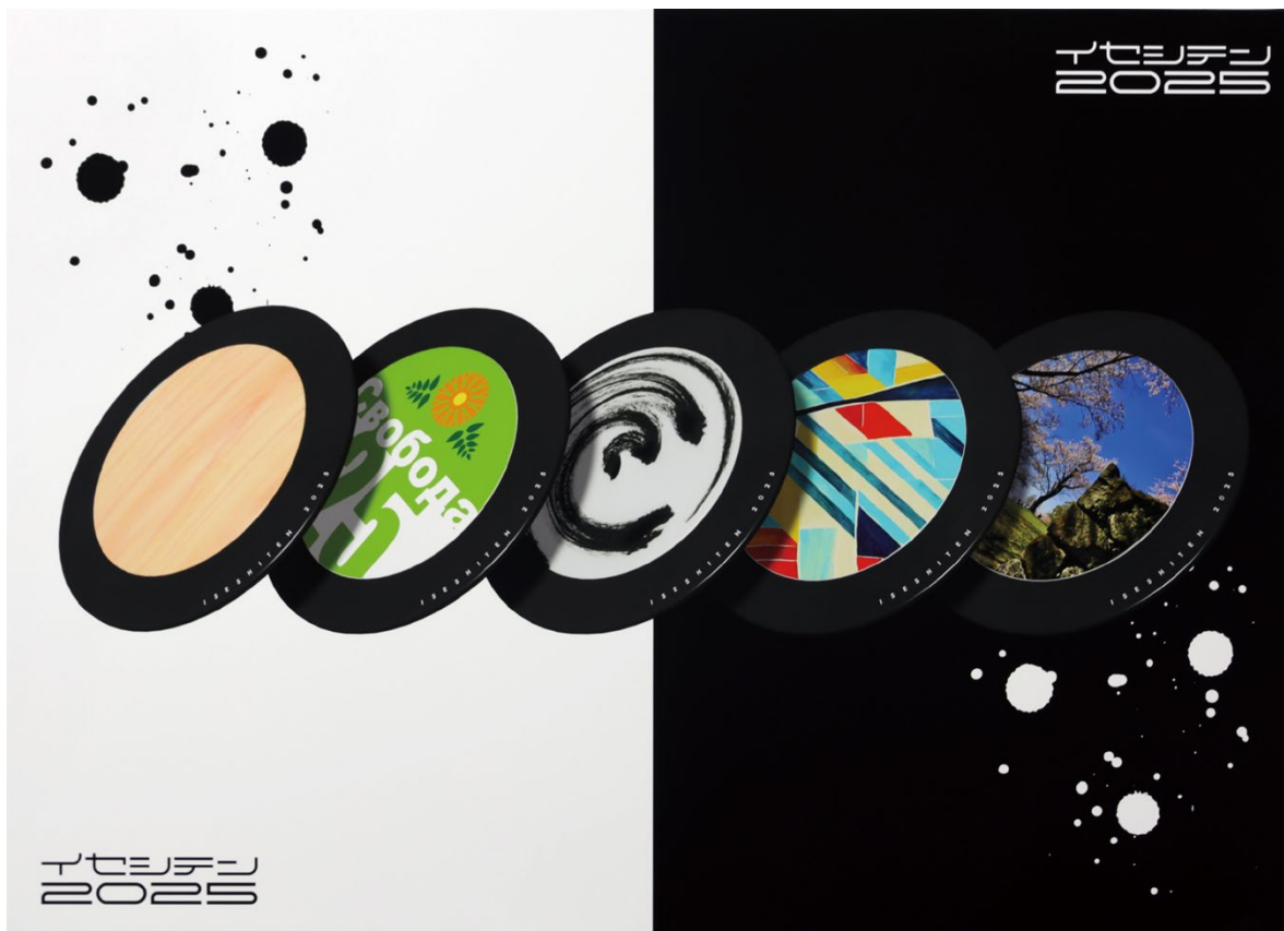
イセシテン2025 山川 毅